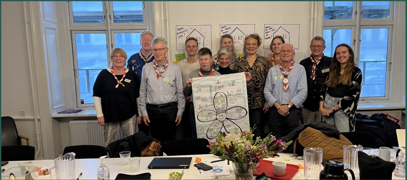
Figur 1: Arbejds møde om Projekt Lejrhjælper i SUS

Udarbejdet af Socialt Udviklingscenter SUS